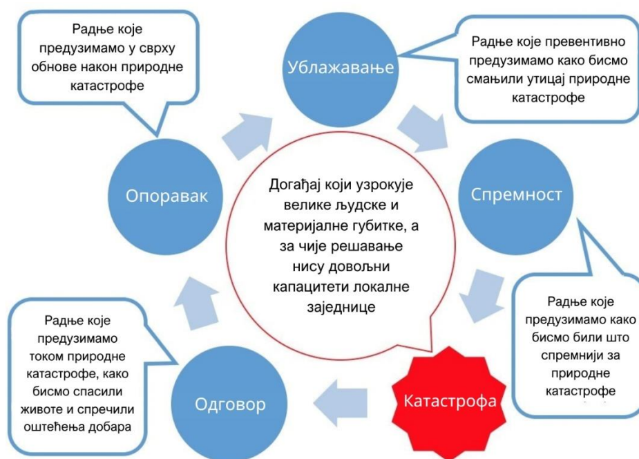
Слика 1: Циклус управљања ризиком од катастрофа

Ови циљеви усмерени су на свеобухватно планирање за све фазе циклуса ризика од природних катастрофа, тако да МЗ Тољевац може дати приоритет акцијама и управљати ресурсима за ублажавање, припрему, одговор и опоравак од будућих катастрофа.