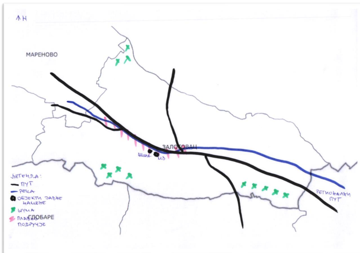
Слика 2: Мапа ризика од природних катастрофа

Како би се просторно схватили постојећи капацитети и рањивости који су претходно идентификовани, учесници су мапирани заједницу, са фокусом на рањивим подручјима. Кроз ову активност дошли су до заједничког разумевања географске распоређености ризика и опасности у заједници (нпр. поплаве, клизишта, ерозија тла, суша и др.), расположивих ресурса који помажу заједници да се носи са катастрофама, као и људи који су најугроженији током катастрофа. Просторно мапирање пружа слојевиту перспективу о томе како природне катастрофе угрожавају заједницу, као и њихов утицај на домаћинства.